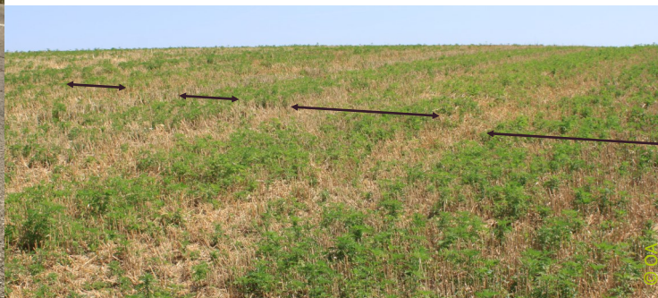
Repousses d'ambrosies liées à la menue paille laissée par la moissonneuse-batteuse de la récolte de tournesol de l'année précédente